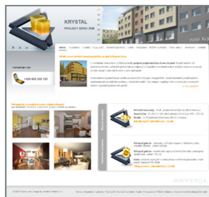
Druhá varianta designu předložená klientovi